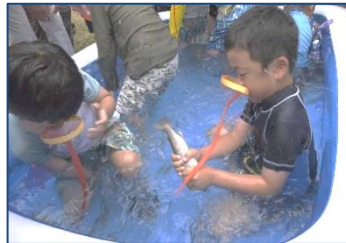
▲ヤマメつかみ取りの様子