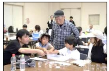
▲体験学習会の様子