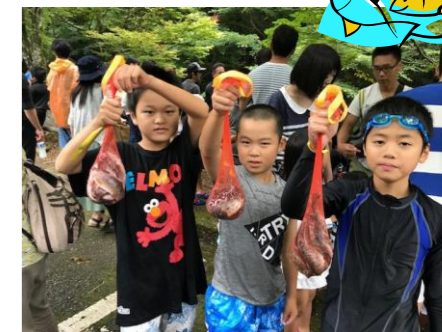
▲たくさん取れたよ～！！