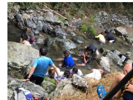
▲冷たい清流でつかみ取り