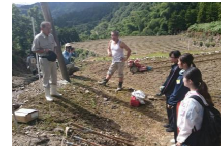
▲泉まち協によるそば畑での研修