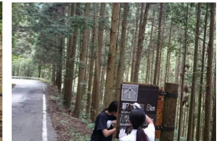
▲看板点検・塗装作業の様子