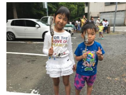
▲塩焼きにして食べるよ！