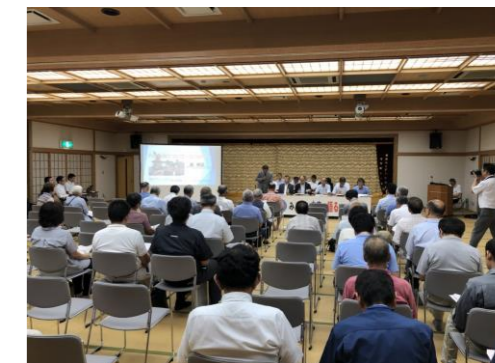
▲市政懇談会の様子

その後、地域住民との意見交換タイムでは、「五家荘地区の公共交通の充実」「老朽化した市有施設の改善や有効活用」「広報紙やつしるへの提言」「超高速ブロードバンド化の具体的な取り組み」「新庁舎建設等、公共工事での八代産材活用」などについて、泉地域住民が抱える切実な悩みなどについて活発な意見が出され、地域の実情や課題等について直接、市長へ伝える事ができ、限られた時間ではありましたが、意義ある会となりました。