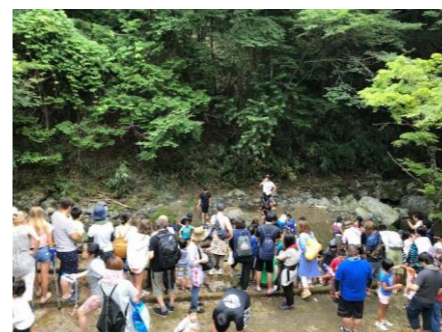
▲多くの参加者で賑わいました