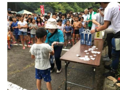
▲お楽しみ抽選会の様子