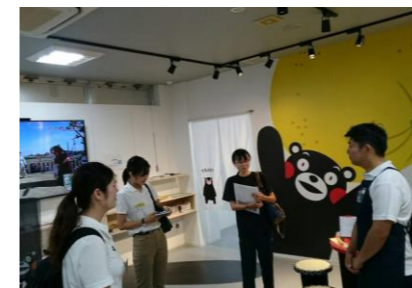
▲くまモンステーションでの研修

今回のインターンシップでは、熊本大学、久留米大学、尚絅短期大学から3名の学生が来られ、泉支所地域振興課の業務を体験していただきました。市の予算や観光情勢に関する座学をはじめ、水道施設見学や観光施設での研修、久連子鶏飼育の取り組み、泉まちづくり協議会の活動視察等、多岐に渡る研修となりました。学生の皆さん、お疲れ様でした。皆さんの今後益々のご活躍を祈念いたします。