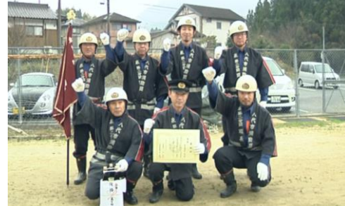
▲優勝した第2分団の皆さん