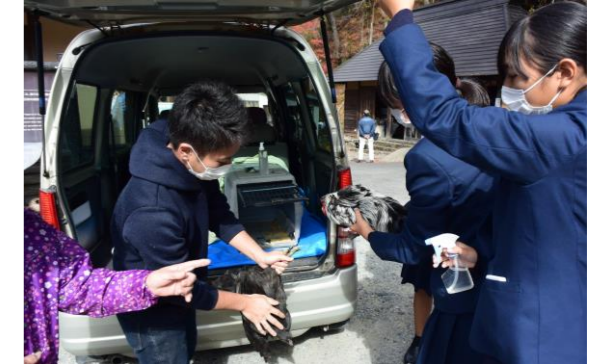
▲ワクチン接種の様子