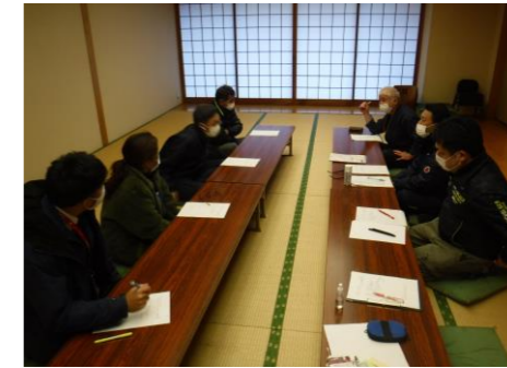
▲新メニュー開発意見交換会の様子