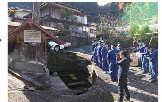
▲岩奥地区での散策の様子

泉町外の生徒さんが多いなか、泉・五家荘について、多くの学びを得られた学習会となったようです。