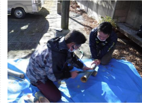
▲竹あかりの制作の様子

泉町観光協会員らは、12月25日からの開催に向け、12月17日には竹あかりの準備を行いました。予め竹林から切っていた竹を切断し、ろうそくを灯せるよう加工しました。その後は、レストランの新メニュー開発の一環として意見交換会も行われ、地域食材や季節食材を使ったメニューの提案がなされました。新メニューは1月に試食会が開催される予定です。また、12月21日・22日には約1万球のイルミネーションの設置が行われました。