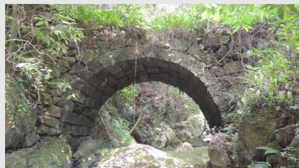
氷川支流糸原川 下流側から撮影

【糸原橋】 江戸末期の架設。橋長6.8m、橋幅2.1m、径間4.12m。泉小中学校を左手に見ながら糸原に向け市道を1kmほど登って行く。最初のヘアピンのコンクリート橋から糸原川を下流側に見下ろすと、今は使われていない古道の石橋が木立の中にひっそりと垣間見える。藪をかき分け川原までおりて行くと、今は渡る人となが、その端正な姿に往時が偲ばれる。（参考文献：上塚尚孝著「熊本の目鑑橋345」熊本日日新聞社刊）