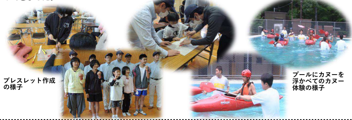
ブレスレット作成の様子

毎年、泉第八小学校の児童とカヌー教室を実施している八農泉分校ですが、今年は7月7日（水）3年生9人と引率教師2人が泉八小を訪れ、クラフト教室、午後からカヌー教室を実施しました。クラフト教室では、泉分校で剥いだシカ・イノシシ皮を原料にした革から、カッターナイフや皮抜きポンチなどの道具を使い、革製ブレスレットを作成。午後は交流給食の後、水泳プールで、生徒の指導でカヌーの乗り方の体験など、泉分校の取り組みへの理解や児童との交流を深めることができました。