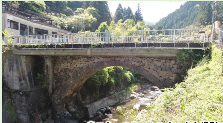
泉コミュニティセンターから撮影