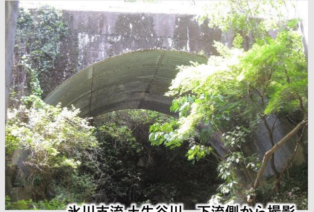
氷川支流土生谷川 下流側から撮影

【土生谷川橋】架設年、橋長、橋幅等不詳。旧泉第一小学校入口の坂道のためと、土生谷川に架かる。国道443号に新しくコンクリート橋が並行して架けられ、現在は歩道として利用。一見、石橋とは気付きにくい。一旦国道脇から階段を氷川までおりて国道橋の下を潜り見上げると、橋の表面がコンクリートと鋼板で補強され石組みは見ることにはできないが、美しいアーチに本体の石橋の面影がうかがえる。（参考文献：上塚尚孝著「熊本の目鑑橋345」熊本日日新聞社刊）