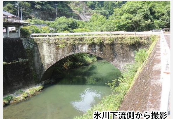
氷川下流側から撮影

【古閑橋】橋長25.8m、橋幅3.3m、径間19.9m。架設時期不詳。松の原地区の氷川本流に架かる市道犬山支線の現役橋梁で、泉支所の橋梁台帳では「松の原橋」、「めがね橋」とも。泉町では最も長い石橋で、昭和43年に橋全体がコンクリートで補強されたことが近くの改修記念碑からうかがえる。コンクリートで覆われたことにより石橋の石組は確認できないが、きれいなアーチに架設当初の姿が思い浮かぶ。（参考文献：上塚尚孝著「熊本の目鑑橋345」熊本日日新聞社刊）