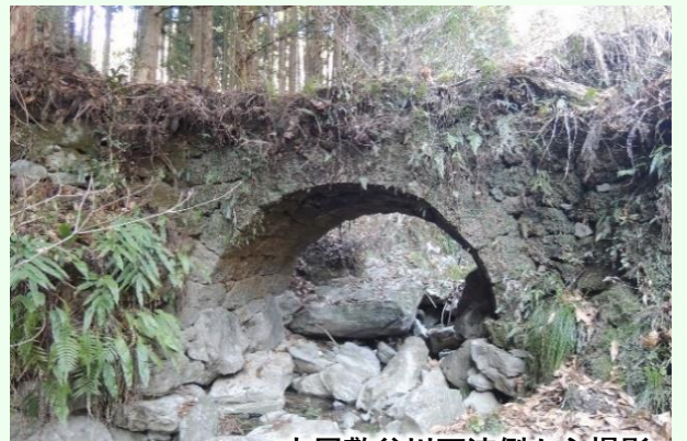
本屋敷谷川下流側から撮影

【本屋敷橋】橋長5m、橋幅2.2m、径間2.76m、架設年不詳。宮原方面から国道443号を進み泉町に入るとすぐに左手にJA茶業センター、そして氷川越しに建設会社のアパートが見える。国道の大道橋を渡りすぐに左折してアパート裏から里道を100m程行くと左手の本屋敷谷川に架かる苔むした本屋敷橋が目映る。往時の端正な姿そのままに木立の中にひっそりと佇んでいる。（参考文献：上塚尚孝著「熊本の目鑑橋345」熊本日日新聞社刊）