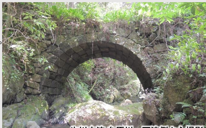
氷川支流 糸原川 下流側から撮影

【糸原橋】江戸末期の架設。橋長6.8m、橋幅2.1m、径間4.12m。泉小中学校を左手に見ながら糸原に向け市道を1kmほど登って行く。最初のヘアピンのコンクリート橋から糸原川を下流側に見下ろすと、今は使われていない古道の石橋が木立の中にひっそりと垣間見える。藪をかき分け川原までおりて行くと、今は渡る人となが、その端正な姿に往時が偲ばれる。（参考文献：上塚尚孝著「熊本の目鑑橋345」熊本日日新聞社刊）