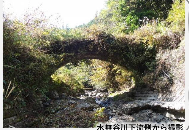
水無谷川下流側から撮影

【広瀬橋】橋長13.1m、橋幅3.1m、径間10.4m、江戸末期架設。「広平橋」とも。松の原から氷川を渡り広平への途中、市道から下岳農免道に左折分岐してすぐ、農道受場橋に並行して氷川支流水無谷川の上流側に架かる。アーチの裏側からは石組を間近に観察できるが、側面は雑木などが根を張り繁茂する枝葉で判然としない。伐採除草など手入れした元来の美しい姿も見てみたいところ。（参考文献：上塚尚孝著「熊本の目鑑橋345」熊本日日新聞社刊）