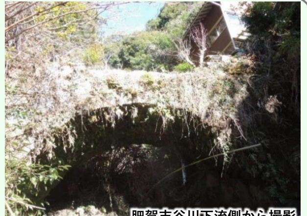
肥賀志谷川下流側から撮影

【小谷橋】橋長7.8m、橋幅2.75m、径間5.66m、幕末～明治初期架設。宮原方面から国道443号を氷川に沿って進むと、国道橋白木平橋のたもとの商店の裏側にある。国道を白木平橋の手前から左折し、宇城市へ抜ける市道泉小川線に入り、すぐ右下に目をやると商店の裏手の氷川支流肥賀志谷川にひっそりと架かっているのが見える。市道からは橋まで草木が茂り容易に近づけない。（参考文献：上塚尚孝著「熊本の目鑑橋345」熊本日日新聞社刊、「泉村誌」）