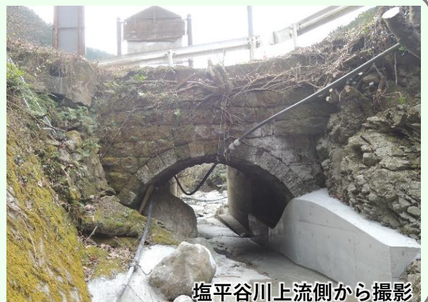
塩平谷川上流側から撮影

【塩平橋】橋長5.5m、橋幅3.9m、径間3.6m、大正初期頃の架設。国道443号を氷川沿いに進み泉町に入る目印になるのが森林組合の案内看板と氷川に架かる県道本屋敷橋。そのすぐ手前で国道が氷川に注ぐ小さな谷川を跨いでいるのが「塩平橋」。そこに石橋があるとは思ってもよらないが、近づいて見てみると、国道を新「塩平橋」と一体となって陰で支える縁の下の力持ちの姿がそこにある。（参考文献：上塚尚孝著「熊本の目鑑橋345」熊本日日新聞社刊、「泉村誌」）