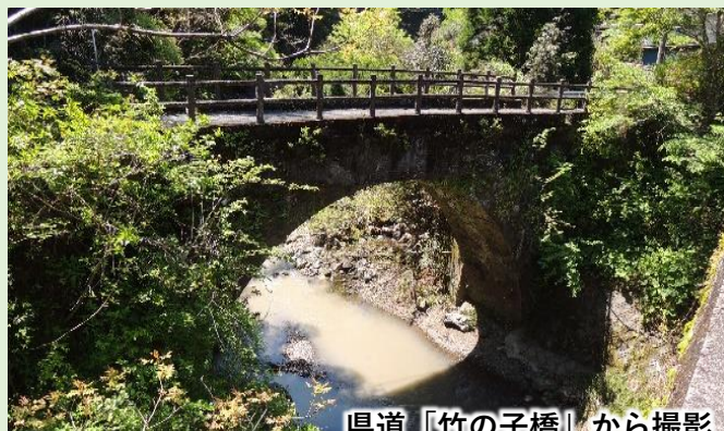
県道「竹の子橋」から撮影

【たけのこ橋】昭和初期の架設という。橋長18.4m、橋幅3.2m、橋高7.7m、径間12.4m。乙川地区の栗木川に架かる。県道久連子落合線の新しいコンクリート製アーチ橋「竹の子橋」と並んで架かっており、現在、歩道橋として利用されている。落合橋と同じく地元野添産出の石材使用。（参考文献：上塚尚孝著「熊本の目鑑橋345」熊本日日新聞社刊）