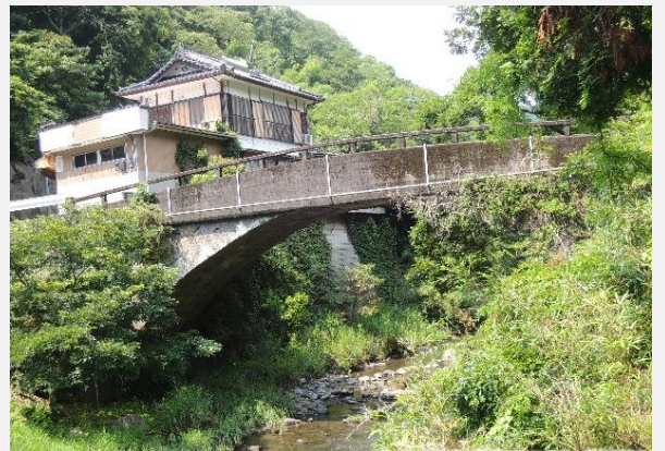
氷川下流側から撮影

【沢無田橋】橋長20.4m、橋幅3.5m、径間18.3m、明治10年架設。下岳神社下の氷川本流に架かる。市道沢無田線の現役橋梁で、国道443号と沢無田地区を結ぶ。泉町では2番目に長い石橋で、橋名板を見ると昭和34年11月20日の記載があり、当時石橋の橋梁上部、高欄部等をコンクリートで補強したことが窺える。橋梁下部には、緩やかなアーチを描く当初の石組を見ることができる。（参考文献：上塚尚孝著「熊本の目鑑橋345」熊本日日新聞社刊）