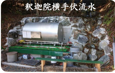
オールステンレスのタンクと蛇口10か所

60年前から山中奥深い30m~50mの所より真水が滾々とパイプから出ています。水質検査の結果、上質の真水であると証明され、害獣による影響もなく、塩素消毒の必要もなく安心して飲めるそうです。