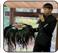
熊本農高生の報告