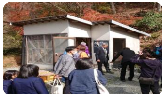
鶏舎(五家荘平家の里)