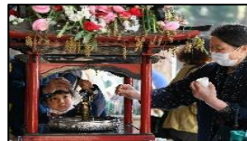
昨年度のグランプリ作品