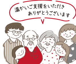
温かいご支援をいただきありがとうございます

令和2年7月4日に発生した令和2年7月豪雨により、八代市内は甚大な被害が発生いたしました。八代市では豪雨災害による被災に対し、義援金、寄附金、ふるさと納税を受け付けております。皆様から多くのご支援をいただいております。誠にありがとうございます。現在も、一刻も早い復旧・復興に向け、全力で取り組んでおります。皆様の温かいご支援を賜りますよう、よろしくお願い申し上げます。