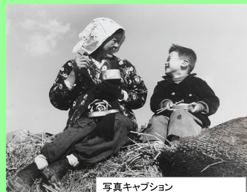
写真キャプション 「お昼どき」 八代市坂本町 昭和23年5月5日

現在写真と解説1300点の整理が終了し、その成果は八代市立博物館ホームページの「収藏品検索コーナー」でご覧いただけます。