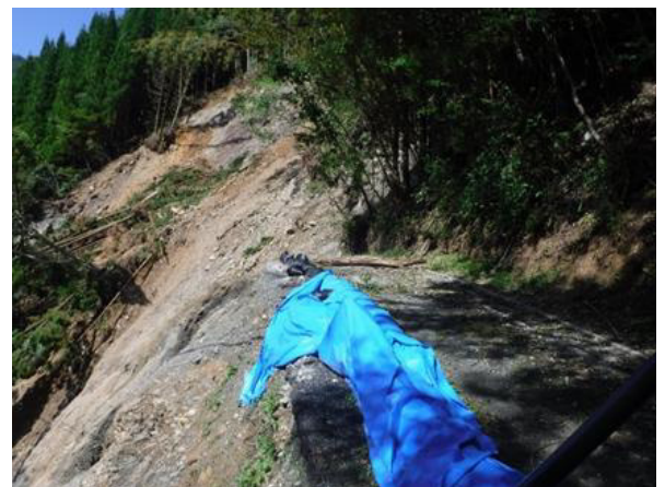
令和4年台風14号の被害状況 (八代市泉町八八重～四方田線：被災箇所①)