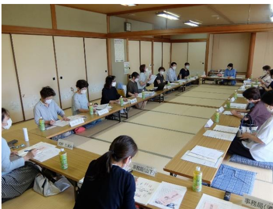
会員学習会の様子

当ネットワークは、男女がともにいきいきと暮らす社会づくりを目指して、地域で活動する個人や団体が集まり結成されました。行政と協働でのイベント開催、啓発グッズの作成、会員学習会、地域との意見交換会、ボランティアなど様々な活動を積極的に行っています。まずは、見学からでも大歓迎です。ぜひお気軽にお問い合わせください。