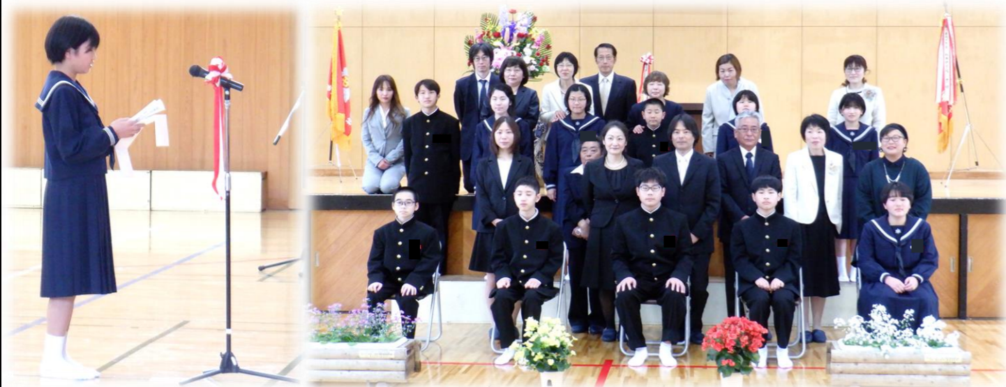
新入生誓いの言葉