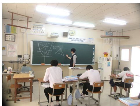
地域未来塾の様子