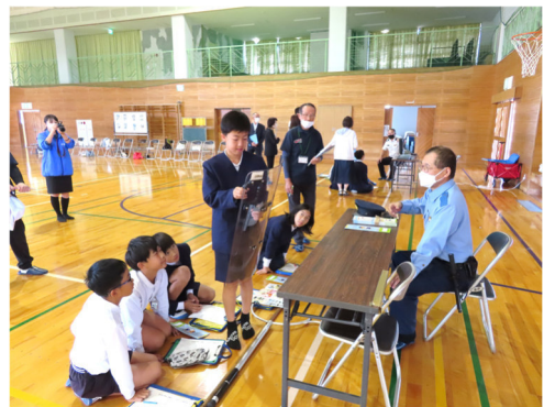
キャリアセミナー