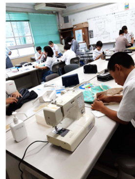
トートバッグ作り