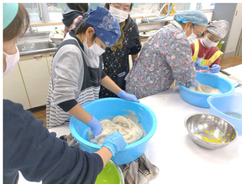
こんにゃく作り体験