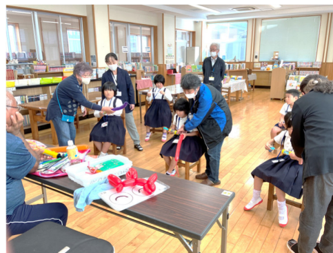
バルーンアート体験