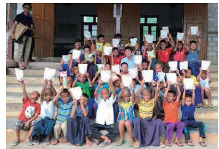
ミャンマーの孤児院にグラノーラの支援

西田精麦は、1929 年の創業から 95 年、「穀物を磨き 未来を創る」という理念のもと大麦などの穀物の加工一筋に歩んできました。