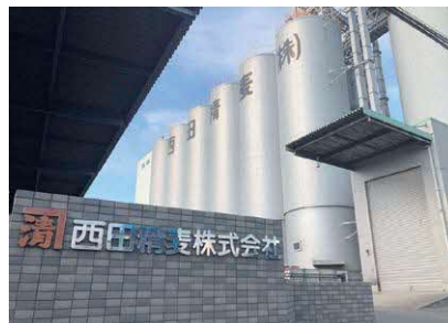
西田精麦株式会社 本社工場