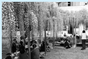
藤棚給食で地域の絆作り

また、昨年同様、夏祭りや景色のいい小路がルートになっている親子歩けあるけ大会など、龍峯地域ならではのイベントにも役員一丸となって取り組み、地域内外に龍峯の魅力を発信していきたいと思えます。