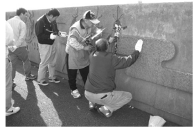
▲日奈久港防波堤の壁画補修