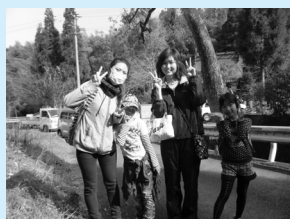
笑顔で歩いて健康づくり