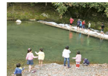
05 人と自然が調和するまち