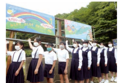
03 安全・安心・快適に暮らせるまち