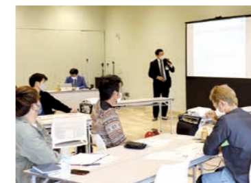
04 地域資源を活かし発展するまち