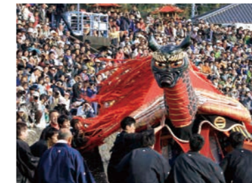
02 郷土を担い学びあう人を育むまち