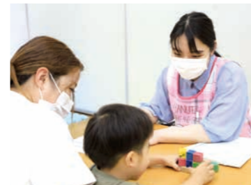
01 誰もがいきいきと暮らせるまち