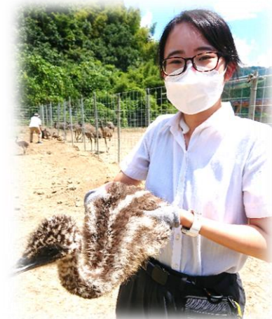
〈エミューを抱えた様子〉

アツアツといえばエミューです!30羽ものエミューのヒナが鶴喰にきましたが、カンカン照りの中抱えたヒナはアツアツでした。どの動物も、子供は体温が高いのでしょうか。それとも暗い色の羽毛のせい? ともかくアツアツな日が続きますが、熱中症にはお気をつけてください。