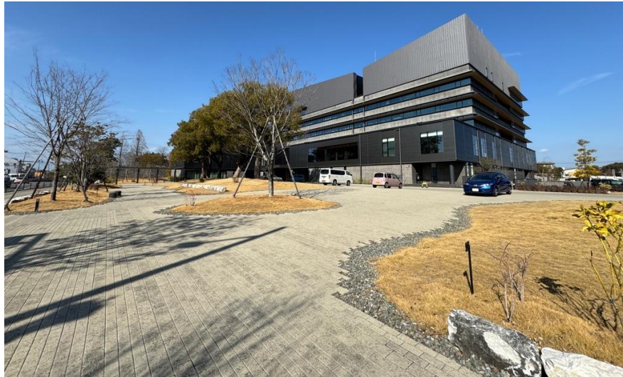
<庁舎南側 みどりの広場>