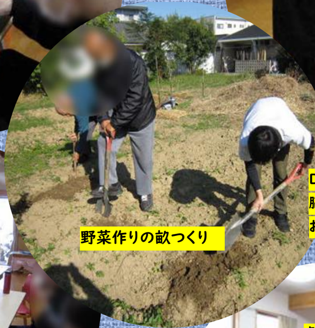
野菜作りの畝づくり

その他 買い物・音楽鑑賞・ DVD鑑賞・美化作業・貼り絵 脳トレ・おやつ作り(季節を感じる お菓子作り)