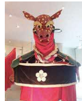
宮原三神宮の原田の亀蛇