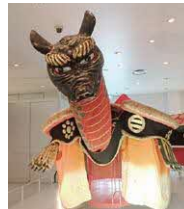
八代妙見祭の亀蛇

観覧料 12月3日(日)まで秋季特別展覧会会期中のため 一般800円 高大生500円 12月5日(火)から 一般310円 高大生200円 ※中学生以下、障がい者手帳などを提示の人は無料