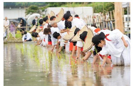
御田植祭の様子