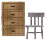
फर्निचर, काठका सामानहरू आदि प्रति दिन 5 वटा सम्म

<ठूलो आकारको फोहर को रूपमा राख्न सकिने वस्तुहरू उदाहरण र मात्राको सीमा >>