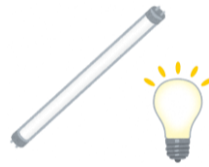
หลอดฟลูออเรสเซนต์ (แบบฟลูออเรสเซนต์) หลอดโคมไฟ ไม่เกิน 20 หลอด ต่อวัน