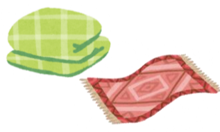
ฟูกนอนพื้น, พรม, ฟูกที่นอน (ไม่มีสปริง) ไม่เกิน 5 ชิ้น ต่อ 1 วัน