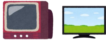
โทรทัศน์ (จอแก้ว CRT, จอ LCD, จอพลาสมา)