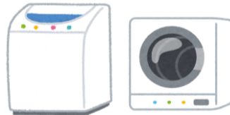
เครื่องซักผ้า, เครื่องอบผ้าแห้ง