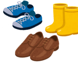
รองเท้าออกกำลังกาย รองเท้าหนัง บูทยาง