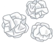
เศษกระดาษ