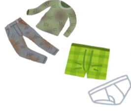
เสื้อผ้าที่เปื้อน สกปรก ชุดชั้นใน