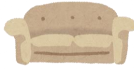
โซฟา, ฟูกที่นอน (แบบมีสปริง) ไม่เกิน 5 ชิ้น ต่อ 1 วัน