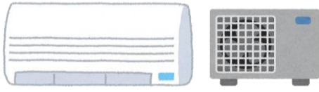
เครื่องปรับอากาศและคอมพิวเตอร์เซอร์