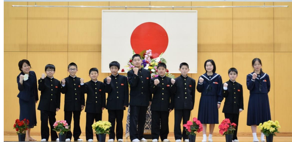
《坂本中学校新入生》