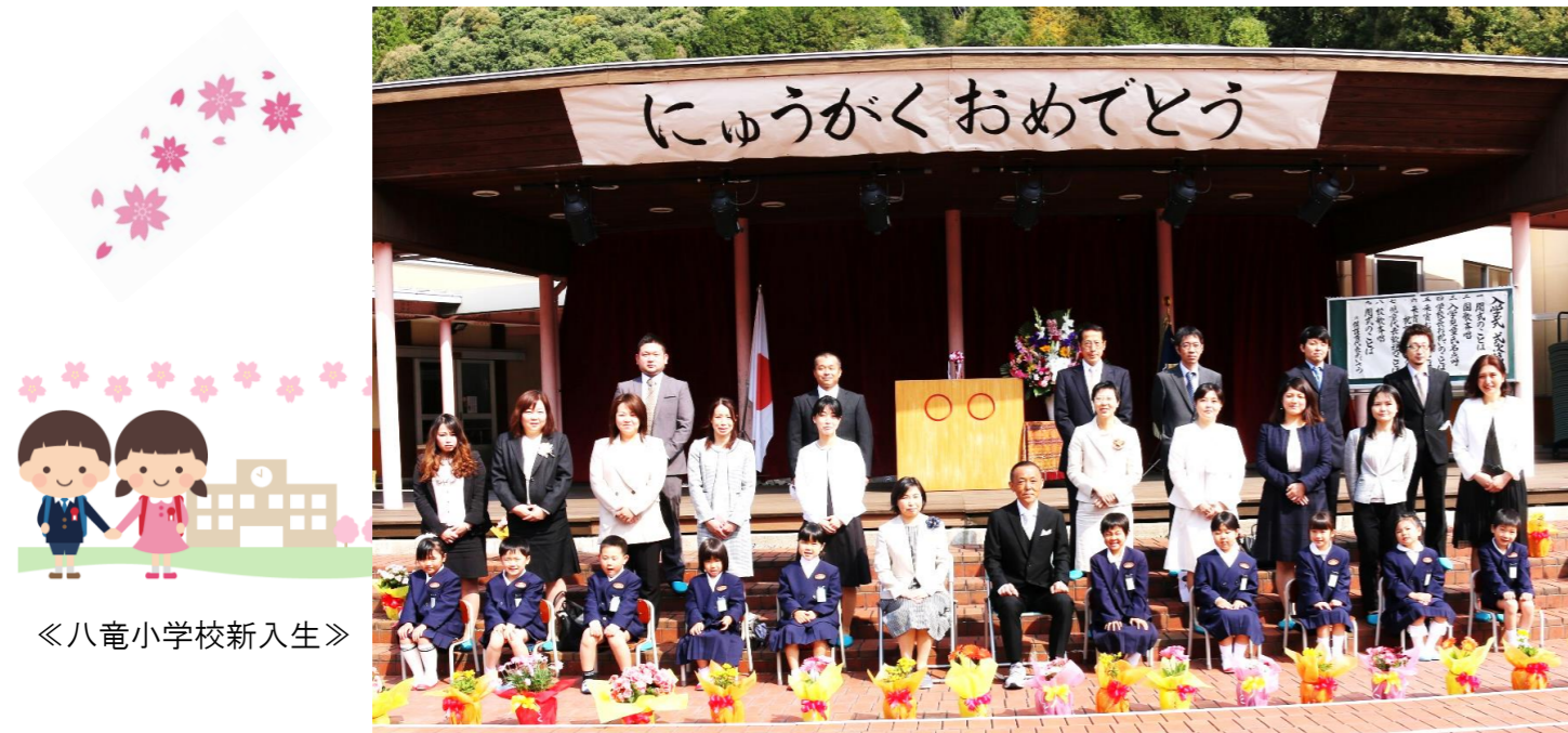
《八竜小学校新入生》

新入生のみなさん、これから、いろいろなことを学び、笑顔いっぱいの楽しい学校生活を送ってください！