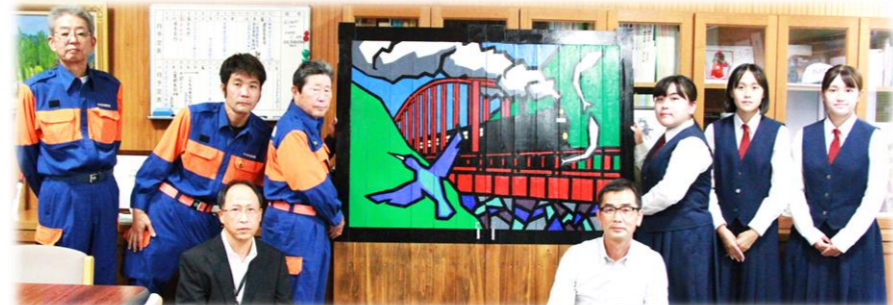
【坂本方面隊第3分団、坂本支所長

扉の絵は、球磨川第一橋梁をSLが煙を吐きながら通過する前を、かわせみが優雅に羽ばたき、球磨川の鮎が飛び跳ねる雄大な様が描かれており、坂本町の皆さんを元気づける力強い作品となっています。