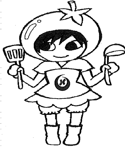
やつしろ とまみ (かんりえいようし)