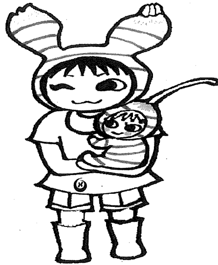
せせらぎ しょうが (じょさんし)