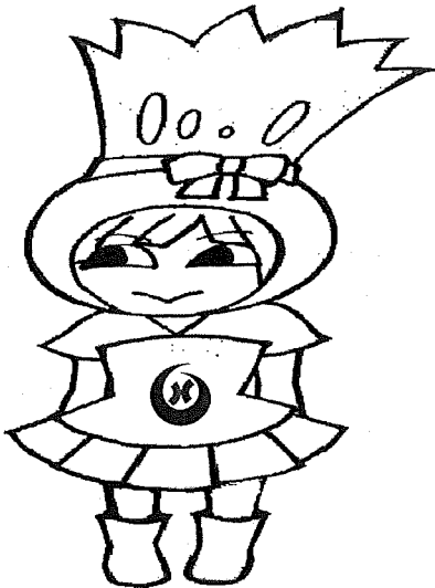
やつしろ いぐさ (しかえいせいし)