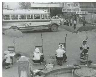
「靴みがき」昭和31年(1956)撮影

観覧料 7月13日(木)まで一般310円 高大200円 7月14日(金)から夏季特別展覧会のため 一般400円 高大300円 ※中学生以下、障がい者手帳などを提示の人は無料