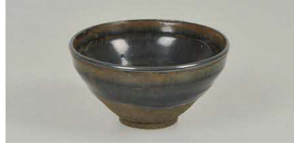
はいかつぎでんもく 灰被天目 中国元～明時代(14～15世紀) 松井文庫所蔵

観覧料 6月4日(日)まで一般800円、高大500円(堅山南風展) 6月6日(火)から一般310円、高大200円 ※中学生以下無料 ※障がい者手帳を提示の人は無料