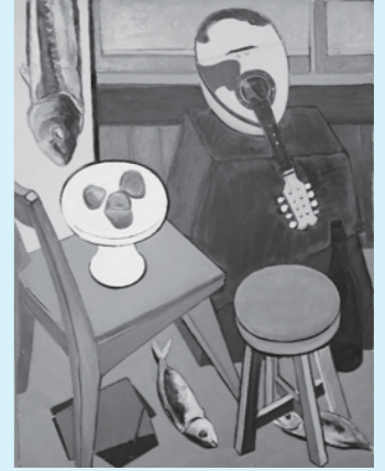
マンドリンのある静物 松田澄夫 1950年代

開館時間 午前9時～午後5時 (入館は午後4時30分まで) 観覧料 ★4/16(日)まで常設展料金 一般310円、高大生200円 ★4/21(金)から特別展料金※詳しくは23ページ 一般800円、高大生500円 中学生以下、障がい者手帳などを提示の人は無料 休館日 臨時休館 4/18(火)～20(木)※展示準備のため 定例休館 4/3(月)、10(月)、17(月)、24(月) 問合せ 市立博物館 未来の森ミュージアム ☎34-5555