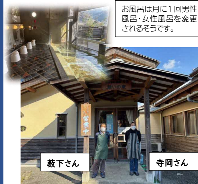
お風呂は月に1回男性風呂・女性風呂を変更されるそうです。

「坂本町で働く人達」インタビュー、今月は“さかもと温泉憩いの家”の寺岡さんと藪下さんです。お話を伺う際にもテキパキと清掃作業を行われていました。ご協力ありがとうございました。