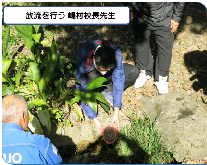
放流を行う 嶋村校長先生