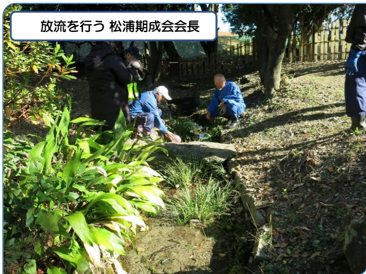
放流を行う 松浦期成会会長