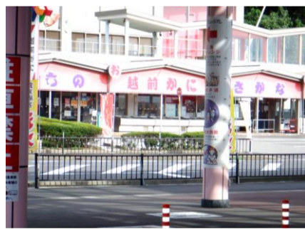
福井県・道の駅「越前」。カニ、喰うぞ！と立寄ったらお休み。この展開は意外に多い!!