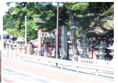
琵琶湖に大鳥居がある白髭神社。近江の巖島神社との愛称で親しまれているらしい。