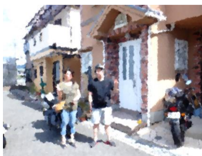
9/2中に弟宅へ到着。義妹と甥っ子が迎えてくれた。大阪は台風の影響はなさそう。