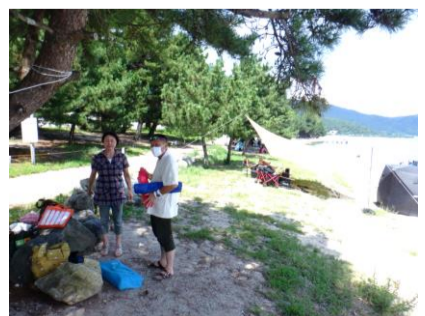
9/3。関西は晴天。テント泊したかった琵琶湖へ戻り、湖畔でBBQ。琵琶湖はでかい。まるで海!