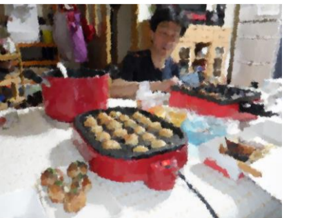
9/4。台風の影響は大阪ではまったくなし。温泉・サウナ満喫後、夕方はたこ焼きパーティー。