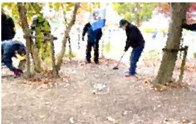
「温知の森」の中にも2つのホールを設定

校区町内対抗グラウンドゴルフ大会（主催：高田校区体協）が、12月3日に高田小特設コースで開催されました。 男子9チーム、女子8チームが参加。校区民の交流を深めながら、2ラウンドを巡りました。 結果は次のとおりです。 男子) 優勝=奈良木、2位=上町、3位=中町 女子) 優勝=上町、2位=奈良木、3位=中町