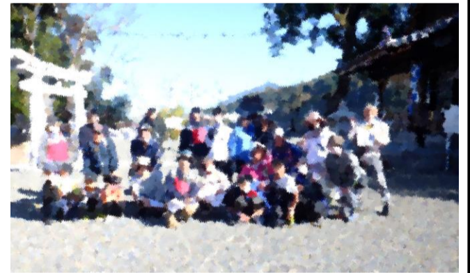
折返し地点の遥拝神社で記念撮影。「同神社の正式名は？」がクイズでした。

12月10日、午前10時。晴天、風おだやか。まち協企画広報部会主催。 この日、高田コミセンに集まった人は、スタッフ合わせて34名。3歳から78歳までの老若男女が、高田の冬の散策を楽しみました。 ゴール後にクイズが出されるとあって、観察とメモに励んだみなさんでした。