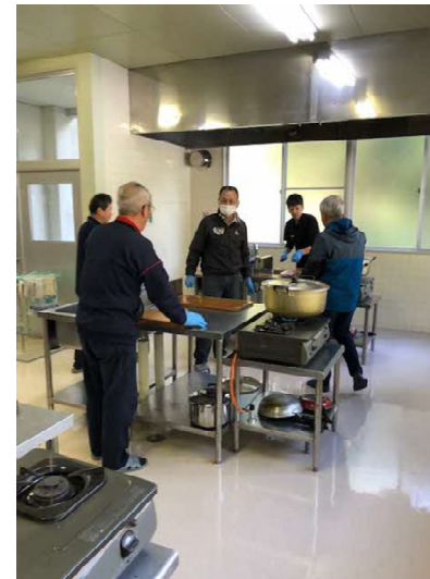
～仕込みの様子～ 猟友会の方から猪肉の骨を頂き ダシにしました！

「今年は寒くなるみたい。」と天気予報で言われていた通りでした。頑張って販売いたしましたが寒空の中、しばらくお待ちいただく事になってしまい、なかなか並んでいただいたお客様皆様を「えがお」にすることが出来なかったと思います。反省点を話し合い、来年に活かしたいと思います。並んで頂いた皆様ありがとうございました。