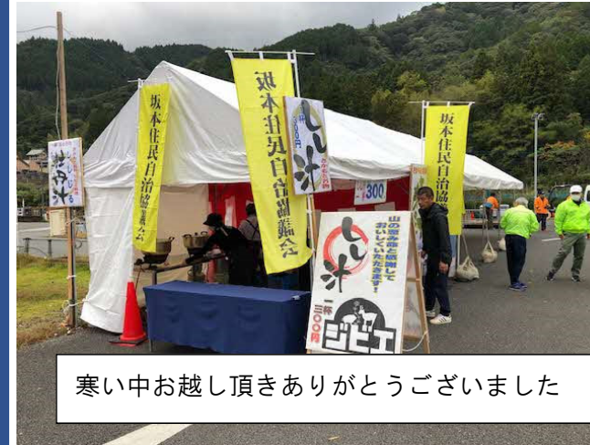
寒い中お越し頂きありがとうございました

令和5年11月12日(日)、さかもと復興商店街周辺にて「第37回坂本ふるさとまつり」が開催されました。今年も坂本住民自治協議会では「しし汁」を提供いたしました。まつりは多くのお客様が来場され、朝早くから賑わっていました。