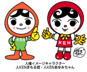
人権イメージキャラクター 人KENまもる君・人KENあゆみちゃん

いじめや虐待、性被害等のこと、人権問題、インターネット上の人権侵害、障害のある人や外国人、性的マイノリティ等に対する偏見や差別、部落差別(同和問題)、ハンセン病差別問題といった多様な人権問題が依然として存在しています。こ