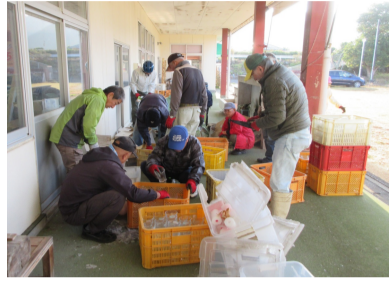
物品の整理をする参加者

りに除草作業が行われ、1時間で見違えるほどきれいになりました。また、引き続き新開町旧若竹保育園の清掃を14人で行いました。まず、倉庫や部屋の中の物品を確認。次にプラスチックケースが破損し、割れたガラスコップの片付けや竹灯籠の整理を行いました。清掃活動に参加された皆さん、大変お疲れさまでした。