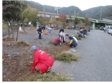
早朝より多数の参加

10月28日(土)午前6時30分から、命日を前に津森小学校遭難の碑周辺の清掃が行われました。早朝にもかかわらず、市職員を含む約40人の参加がありました。細かい所まで念入