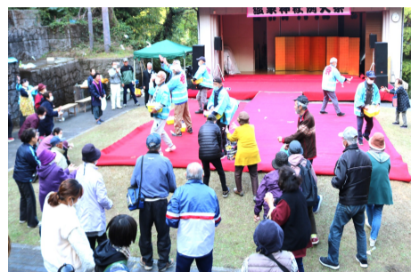
餅投げに集う観客

その後は、住民有志による奉納演芸大会が開催され、踊りや歌で盛り上がりました。今年はマジックショーや中国琵琶の演奏もありました。トリを飾った下町有志による踊りは、今年も健在で、飛び入りまで入って大いに盛り上がりました。 最後に紅白の餅投げがあり、会場に詰めかけた観客は、声を上げて餅を拾いました。請前町内の中西町及び関係者の皆さん、大変お疲れ様でした。