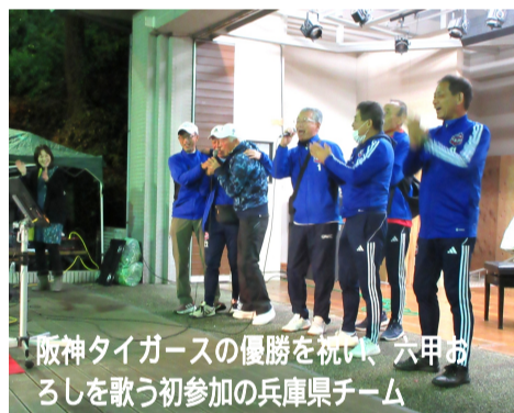
阪神タイガースの優勝を祝い、六甲ふるしを歌う初参加の兵庫県チーム

テントに行列ができました。続いてアトラクションがあり、エクアドルの陽気な音楽にあわせてお酒が進みました。ヤギの爪を使った珍しい民族楽器を小学生が演奏するなど盛り上がりを見せました。次にステージでは、カラオケが披露されましたが、ダンスあり、ハーモニカ演奏あり、多彩な芸でたくさんの方々が盛り込まれていました。主催者の挨拶であった「サッカーファミリーの輪が広がる」2時間半のレセプションでした。準備や後片付けに参加された皆さん、大変お疲れさまでした。