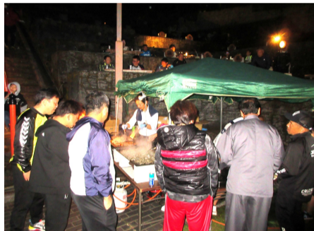
焼き肉やおでんを待つ参加者

歓迎レセプションは、日奈久温泉神社イベント広場において、午後6時30分から行われました。来賓挨拶など開会行事が終わり乾杯があり、日奈久から出店した竹輪・ラーメン・焼き肉・おでん・飲み物・おにぎりなど6つの