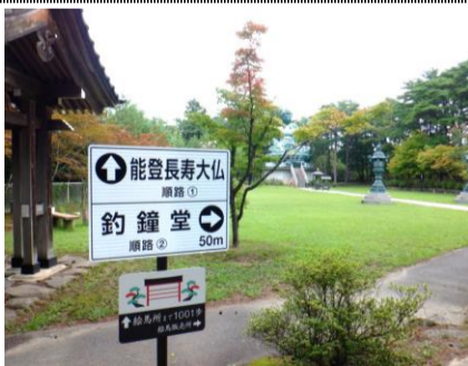
石川県穴水町の“能登長寿大仏”。家族・親族の健康、長寿、安全を祈願した。