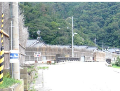
重要文化的景観の『間垣』。約5mの高さに竹を結束。冬の日本の強風から家を守っている。