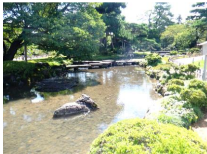
日本三大庭園の兼六園。歩き回り大汗をかいたので、茶店でかき氷 金沢城も廻りました。