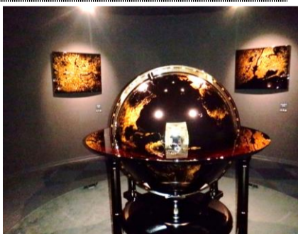
輪島漆芸美術館の輪島塗大型地球儀。幾重にも塗られた輪島塗は400年を経ても健在!