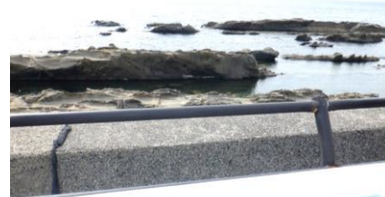
福井県に入る。楽しみにしていた東尋坊を通り過ぎてしまい、代わりに弁慶の洗濯岩を見学。