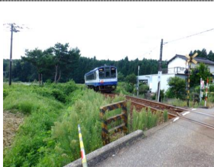
能登半島のきれいな海岸沿いを走るJR七尾線。学生時代に乘った鹿兒島本線にどこか似ていた。