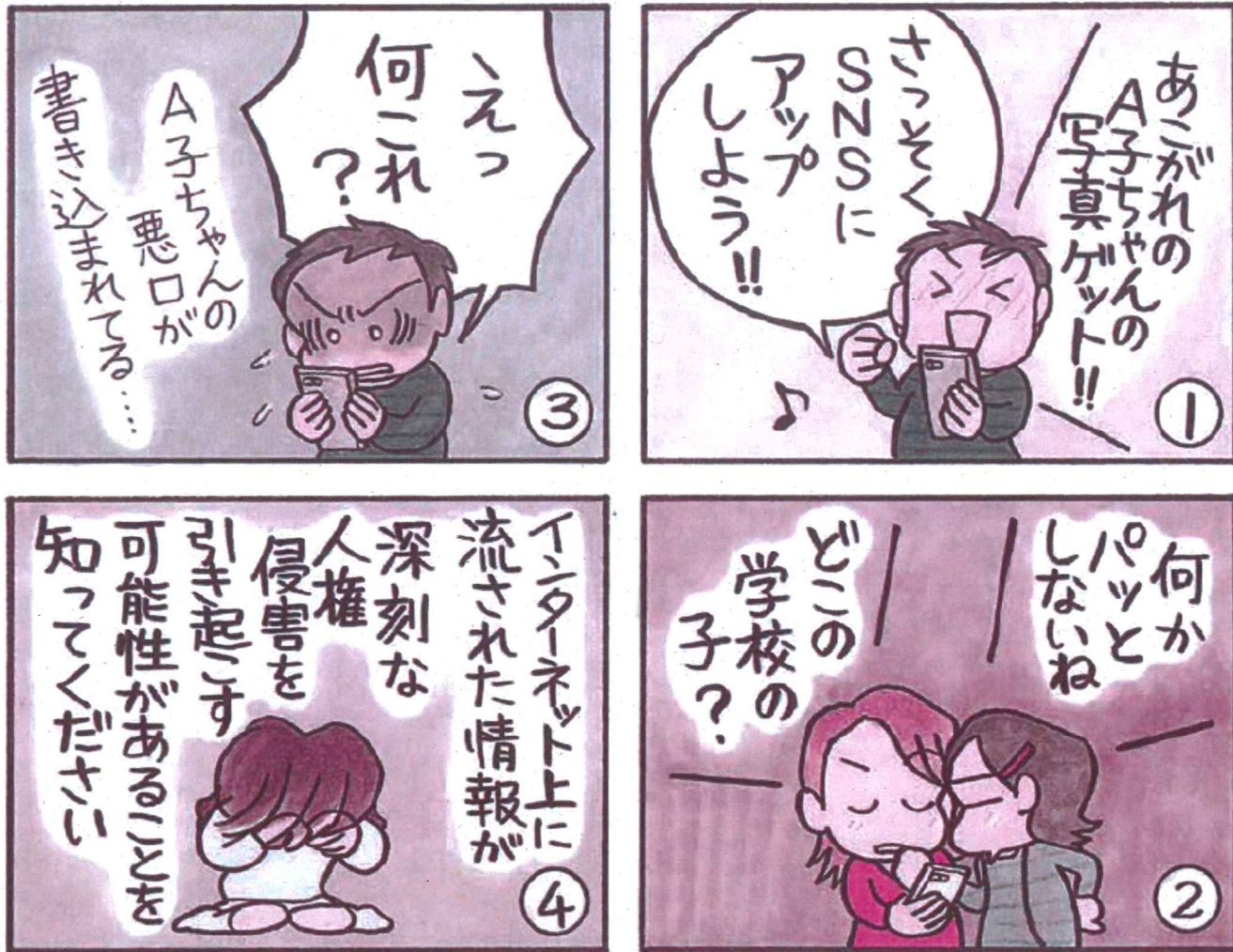
(漫画: 桜田幸子さん)