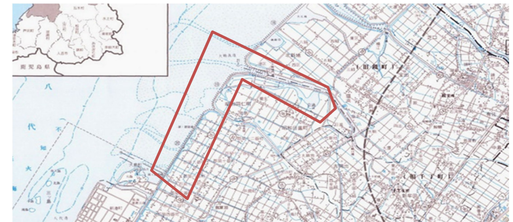
有害鳥獣駆除活動図