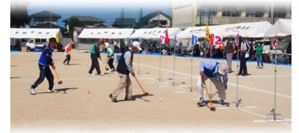
過去の競技の様子から