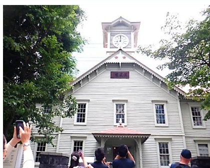
雨のサッポロ。時計台。有名がゆえに、でっかい柱時計のイメージがあったが、ちがった…