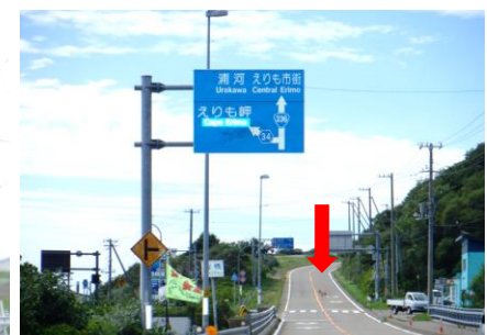
もうすぐ襟裳岬という所でエンジンカと遭遇。キタキツネにも遭ったがカメラ間に合わず。