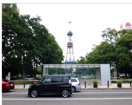
大通公園から見たテレビ塔。こちらの時計はデジタル。昨日までビール祭りだったとのこと(悲)