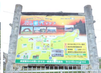
根室半島突端の納沙布岬へ。霧で四島は見え。早期返還を祈願して旅を続ける。