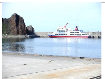
場所が大きく移って知床・ウトロ港。遊覧船の悲惨な事故があったところ。運航は再開。