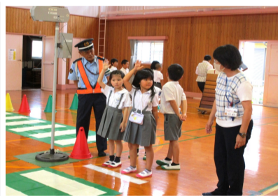
「左右確認、手を上げて」

交通ルールを守ります 日奈久小で交通教室 7月5日(水)に日奈久小学校体育館において、交通安全教室が開催されました。新型コロナウイルスの関係で、3年ぶりの開催となりました。 八代警察署から2名、市役所から2名と日奈久交通指導員5名、計9名の指導員で実技の指導を行いました。 2時間目に1・2年生15名が、交通安全教育講習員から交通安全について話を聞きました。その後、横断歩道の渡り方や信号の見方の実技指導を受けました。 3・4時間目には、3・4年生17名が自転車の正しい乗り方について話を聞き、体育館に作られたコースを自分の自転車に乗って、実技指導を受けました。