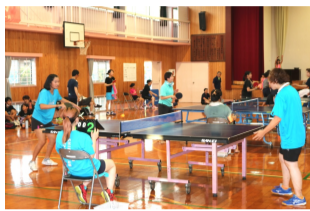
熱戦を繰り広げる選手達

うだるような暑さの中、7月15日(土)に日奈久小学校体育館で卓球大会が4年ぶりに行われました。大坪町、新田町、山下町、竹之内町、塩北・新開町、塩南町、東町・中町、浜町の8チームの小学生から80代の幅広い選手が参加しました。