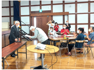
委任状の交付を受ける ふれあい委員

6月15日(木)ゆめ倉庫において、ふれあい委員委嘱状交付式並びに研修会が午前・午後の部に分散して実施されました。