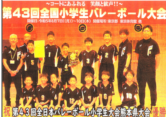
第43回全国小学生バレーボール大会