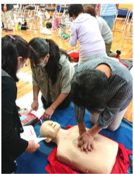
胸骨圧迫をする参加者

令和5年度日赤講習会が、7月10日(月)に日奈久ゆめ倉庫で開催されました。婦人会は日赤奉仕団の一員としていろいろな活動をしています。今回は大切な命を守るための「救急法」を学びました。胸骨圧迫、AEDの使用方法等、講習を何度受けても緊張します。もしもの時に慌てないために訓練が大切だと思います。