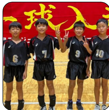
左から、古川くん、田口くん、草野くん、草野くん