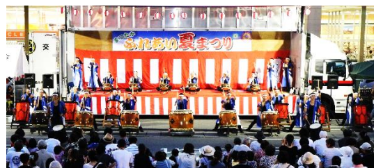
秀岳館高校 雅太鼓演奏