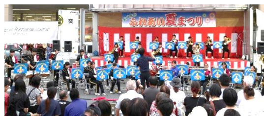
八代一中 吹奏楽演奏