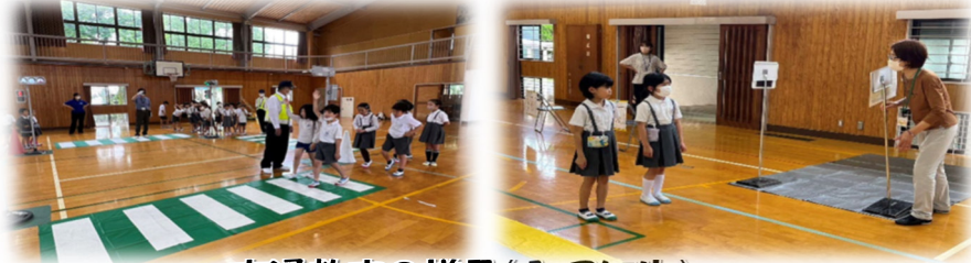
交通教室の様子(1・2年生)

5月に1、2年生を対象に交通教室が行われ、代陽婦人会の皆さんにお手伝い頂きました。