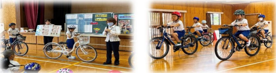
交通教室の様子(3年生)

7月4日(火)には3年生を対象とした交通教室がありました。八代警察署交通安全課指導員の方々、代陽校区交通安全協会指導員の方々を指導者に迎え、ヘルメットの正しい被り方、自転車乗車練習のサポートとして、代陽婦人会の皆さんにお手伝い頂き、今後、自転車に乗る時、安全に気をつけて自分の命を守る！と子ども達も真剣に学んでいました。