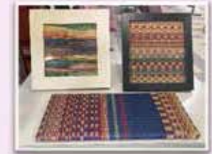
花ござ手織りの会が作られた作品群 ←