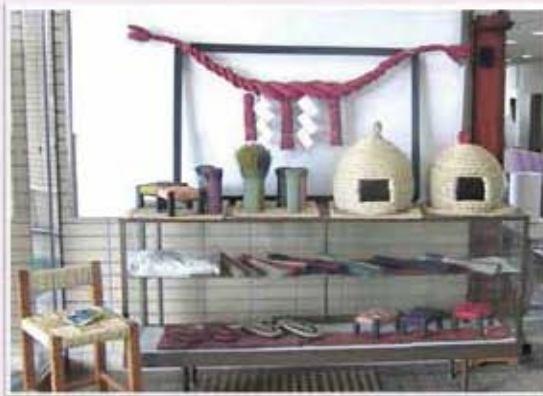
正面玄関 右側展示 ←

今後も地域の皆様、各団体の方々と連携を図りながら、支所職員一丸となり、「緑豊かな自然と調和したにぎわいのあるまち 千丁」を目指して参りますので、どうぞよろしくお願いたします。