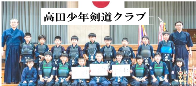
高田少年剣道クラブ

高田少年剣道クラブは、「第48回熊本県剣道道場連盟少年剣道錬成大会（6/3合志市総合体育館）」において、決勝トーナメントに進出し、見事、県代表となり全国大会出場を決めました。