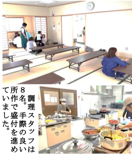
調理スタッフの進めは、8名で盛付を進め、手際の良い仕上げを行いました。