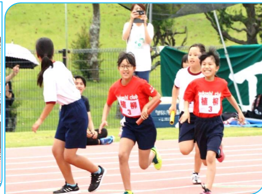
【若い選手達の力走】