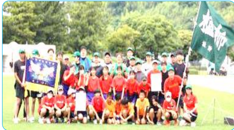
【出場された選手の皆さん】