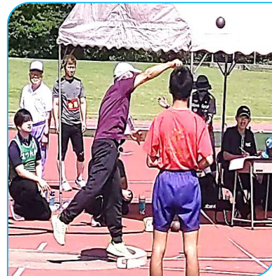
【松浦体協会長の力投】