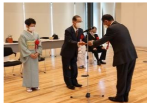
八代市ホームページより抜粋