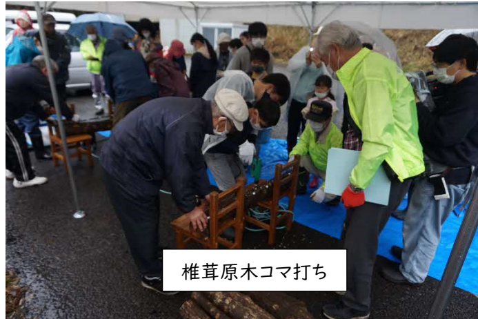
椎茸原木コマ打ち