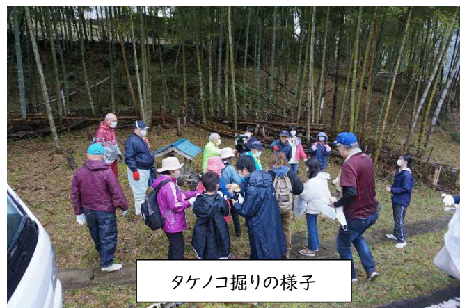
タケノコ掘りの様子

工事関係者並びに地域の企業の皆様から多くの協賛金や協賛品を頂きました。来月号より企業名を掲載いたします。